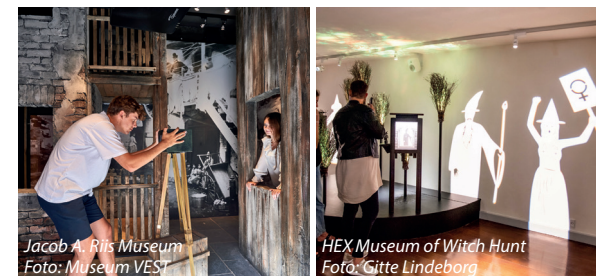
Jacob A. Riis Museum