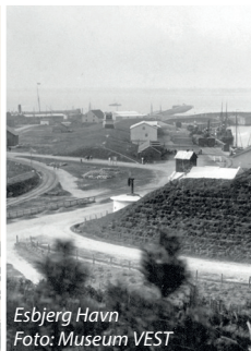
Esbjerg Havn