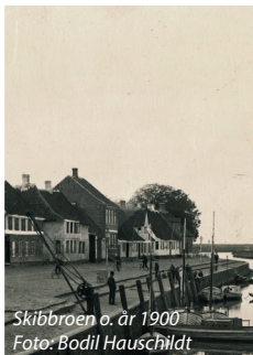
Skibbroen o. år 1900